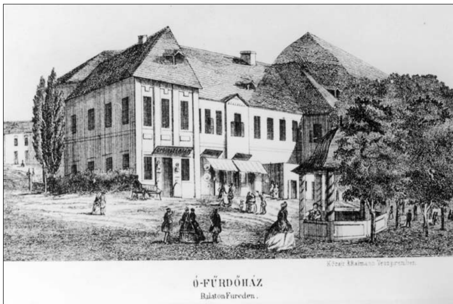
Az 1765-ben épült ófürdőház

dő kórház 20 évi szünet után (1800 és 1820 között) megnyílt és 1835-ben új épületbe, a kerek templomtól délre költözött. 1863-ban még működött, későbbi sorsa azonban ismeretlen.