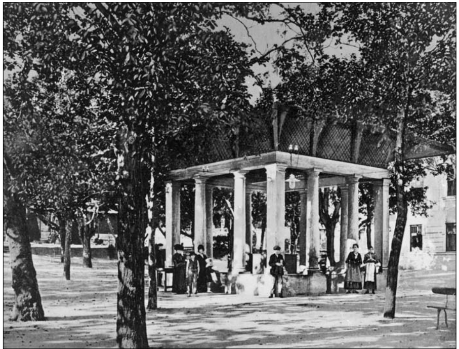
A 100 évvel ezelőtti Ferencz József forrás

Először Lower Máté 1694-ből származó német nyelvű könyvében lehetett olvasni a településről. Leírja, hogy a Balaton parton két forrás mocsarassá teszi a környéket. Szeszés, tiszta, savanyú, frissítő és elevenítő a vizük, ezért a pásztorok és a parasztok szívesen felkeresik. Az első magyar nyelvű leírás az 1700-as évek elejéről származik, de az igazi szakszerű közlést Bél Mátyás polihistor hagyta ránk, aki 1731-ben járt a Balaton környékén. Füredről így ír: „Nagyobb hírnévre és látogatottságra tett szert a másik fürdő, melyet Tihany félszigetén túl Fördöd falu igazgat. Ez már erősen savas forrás, kettős kútja is van és kb. 30 ölnyire fekszik a tó partjától. Az egyik kút vize inkább ivásra használatos, mivel sokkal hígabb és kellemesebb ízű a másikonál. A másik kút nem ad oly kellemes ízű vizet, de sokkal bőségebben, éppen ezért inkább fürdésre, mint ivásra alkalmas. Ehhez a kúthoz egy kis épületet is hozzászerkesztettek,